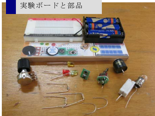
実験ボードと部品