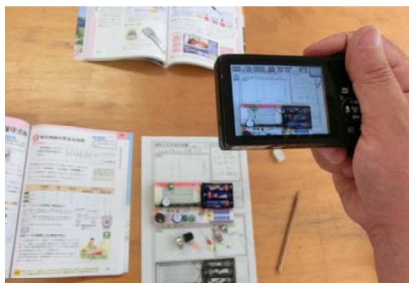
学習カードと共に撮影して協働学習に